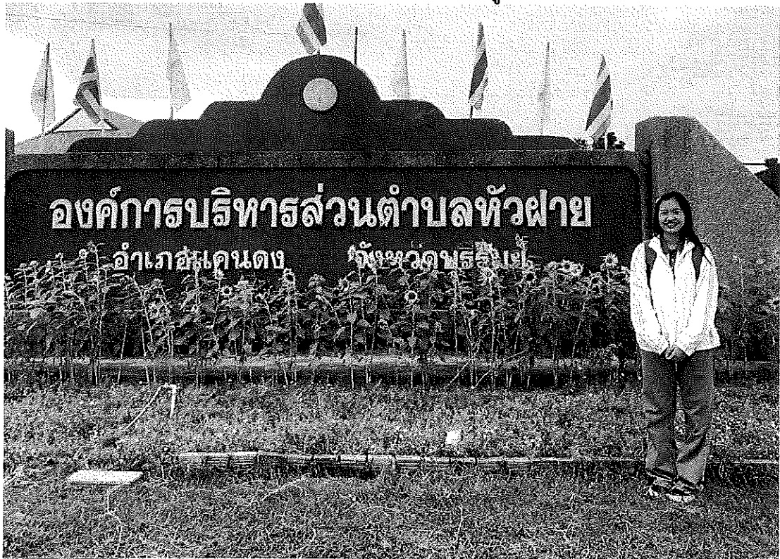
ภาพประกอบการสำรวจข้อมูล