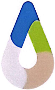
สัญลักษณ์รูปหยดน้ำ

อถล. เป็นการรวมกลุ่มของประชาชนในท้องถิ่นที่มีจิตอาสาในการช่วยเหลืองานขององค์กรปกครองส่วนท้องถิ่น เกี่ยวกับ การจัดการสิ่งปฏิกูลและมูลฝอย การปกป้องและรักษาทรัพยากรธรรมชาติและสิ่งแวดล้อม